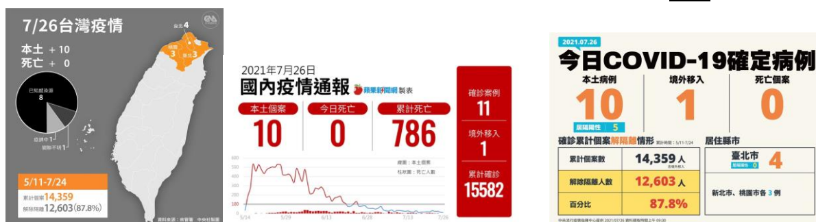
圖 1 7/26 本土確診新增數

(一) 7 月 26 日本土確診新增 10 例，疫情持續穩定，死亡連續 2 天加零，詳見圖 1